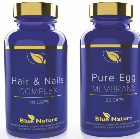
Hair & Nails COMPLEX Kod 5066

Dodaj Pure Egg MEMBRANE – sposób na piękną skórę!